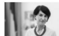
Violeta Victoria Alexandru Ministrul pentru Consultare Publică și Dialog Civic